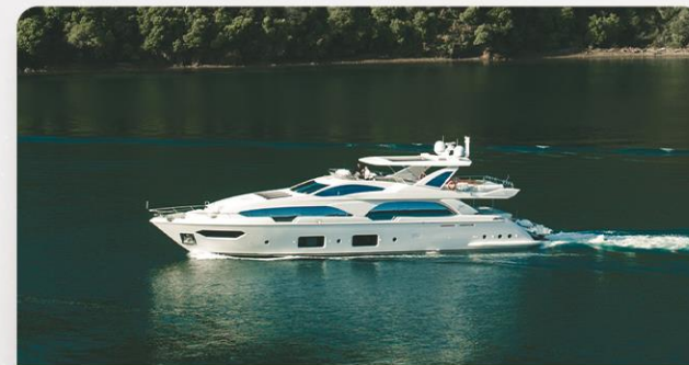
豪华游艇·私人岛屿